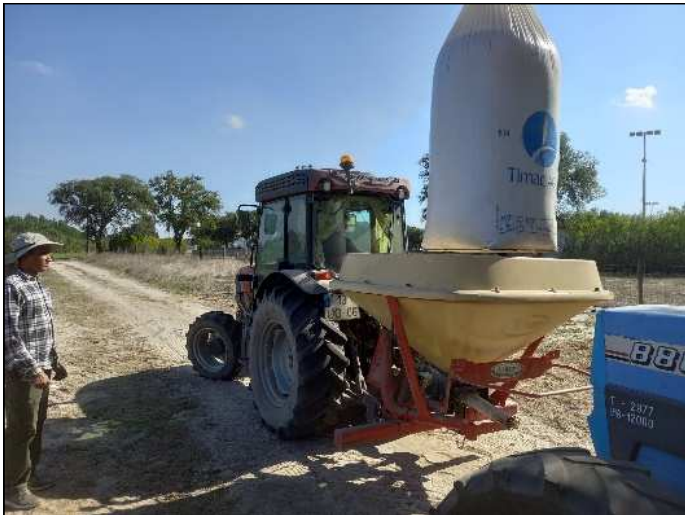
Figura 2 – Aplicação de fertilizantes orgânicos peletizados e minerais granulados em adubação a lanço com distribuidor de adubo antes da sementeira (Palmela, 2021)